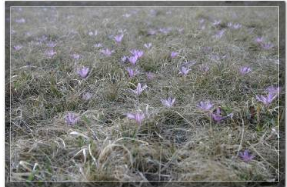
Степа на пешчари

Еколошка карактеризација Пешчаре несумњиво зависи од антропогеног фактора, његове разноврсности, порекла и снаге дејства. Ширењем градских целина ка срцу пешчане зоне узурпирани су природни екосистеми, а они на ободном делу и уништени. Захваљујући постојању шумских комплекса, до самог северног руба урбане зоне, спречен је јачи притисак на ово подручје. Данашња ситуација је таква да урбанизоване површине опасују Пешчару од Келебије до Хајдукова. Међусобно су повезане магистралним путем, а међународна железничка пруга дели заштићено подручје на два одвојена дела.