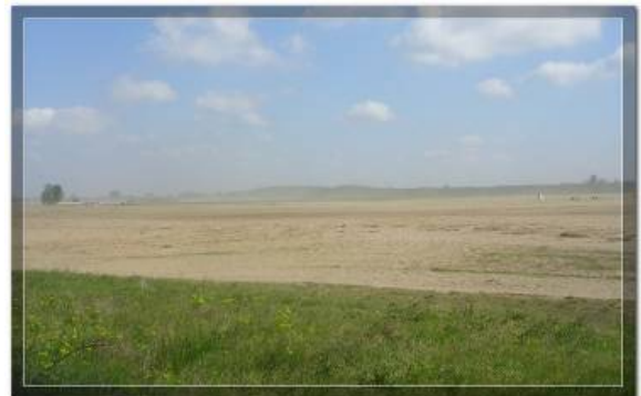
Слободан песак на пољопривредним површинама