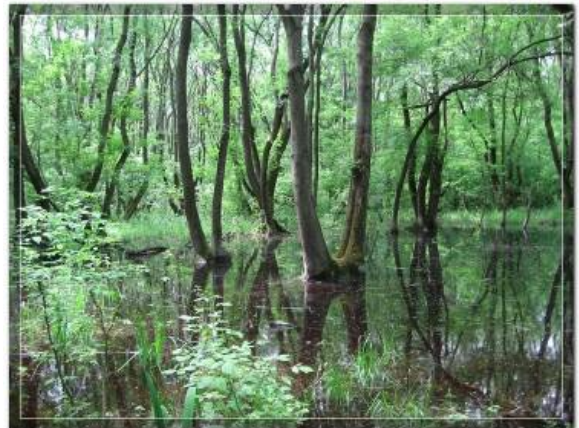
Периодично плављени део Јасеновачке шуме