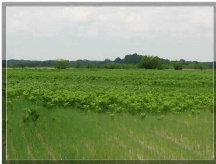
Ширење инвазивне врсте Asclepias syriaca

Угрожавајуће факторе представља ширење инвазивних врста, као и зарастање чистина ширењем жбунасте и дрвенасте вегетације.